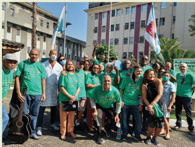
Hospital Federal de Bonsucesso + GAL Rio de Janeiro - RJ