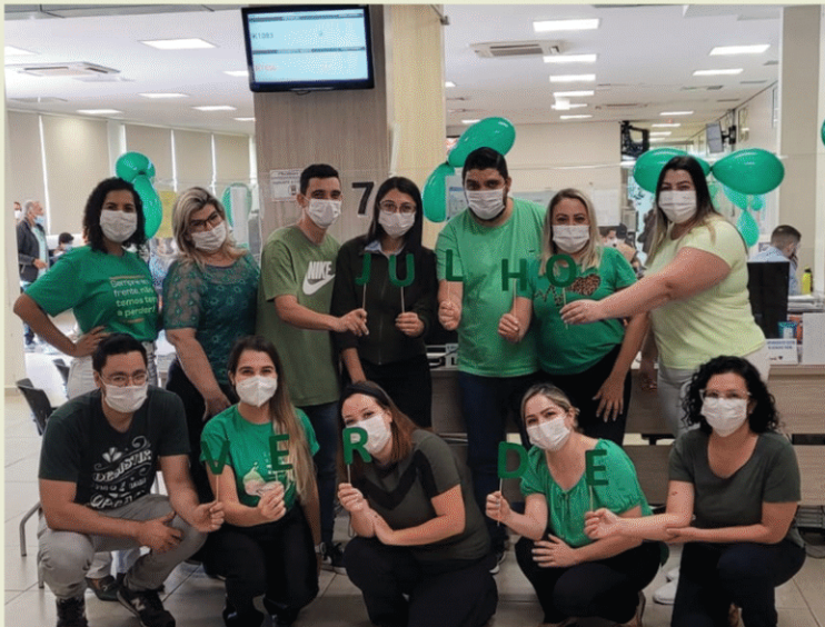
Instituto do Câncer (ICA) + GAL SP. São José do Rio Preto - SP