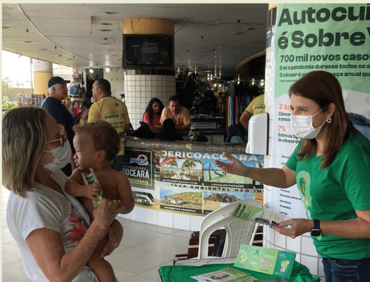
UNIFOR no Mercado Central de Fortaleza. Fortaleza - CE