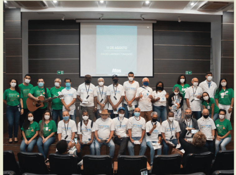
Fundação Cristiano Varella. Muriaé - MG