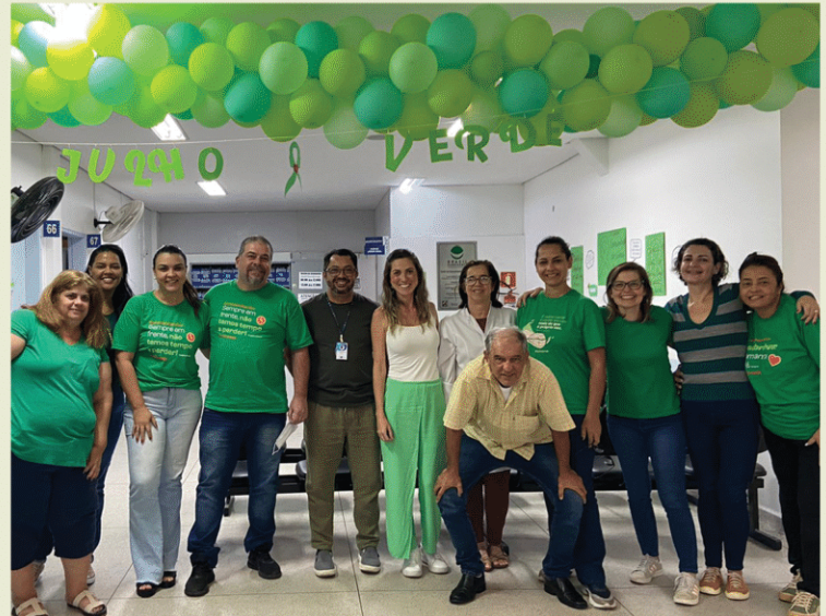
Centro de Especialidades Odontológicas. São Sebastião - SP