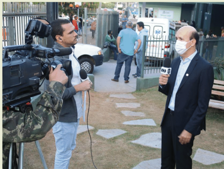
ACCG - Hospital Araújo Jorge. Goânia - GO