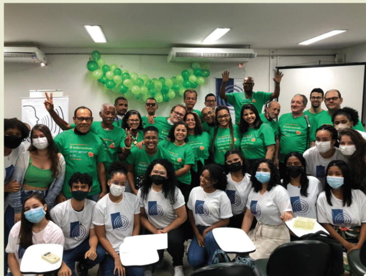
LAVOZ + Larigectom. Salvador - BA