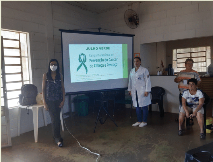
Unidade de Saúde da Família + Cras. Guaíra - SP