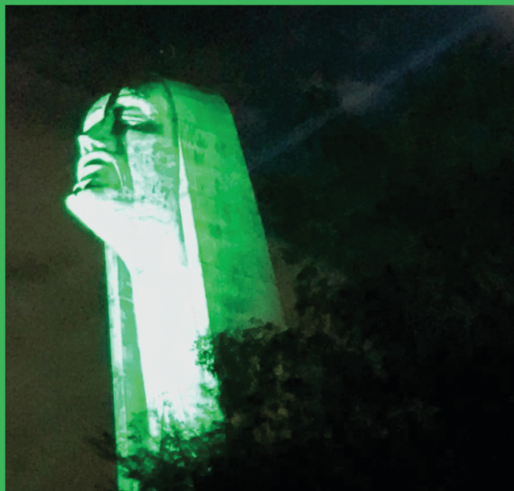
Monumento Jesus Terceiro Milênio Caxias do Sul - SC