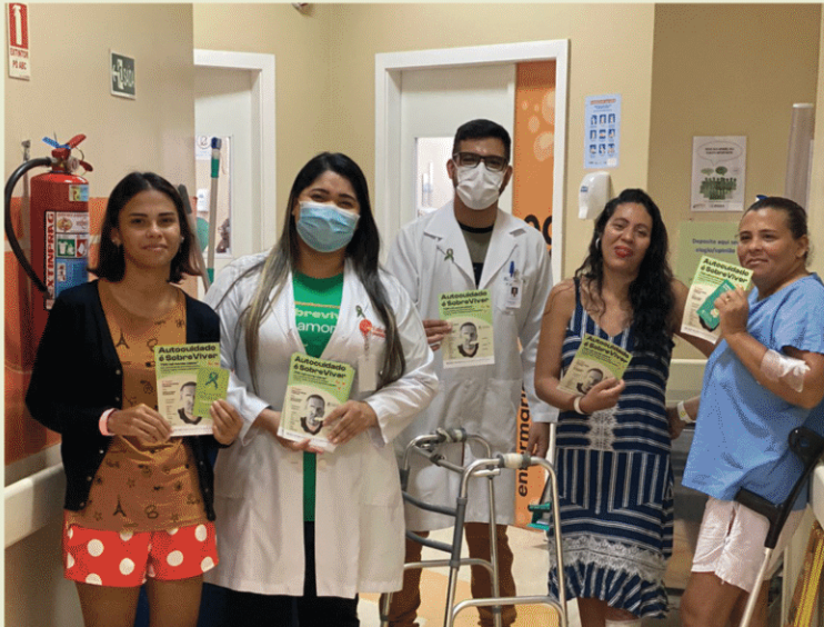
Hospital Público Estadual Galileu. Belém - PA