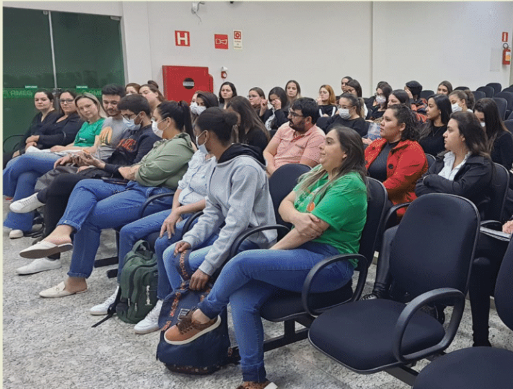
Santa Casa dos Passos + HRC. Passos - MG