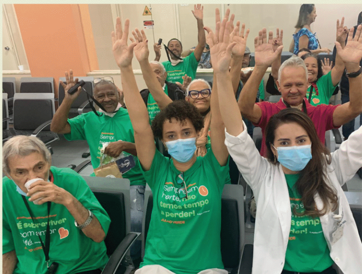
Hospital Universitário Pedro Ernesto (HUPE). Rio de Janeiro - RJ