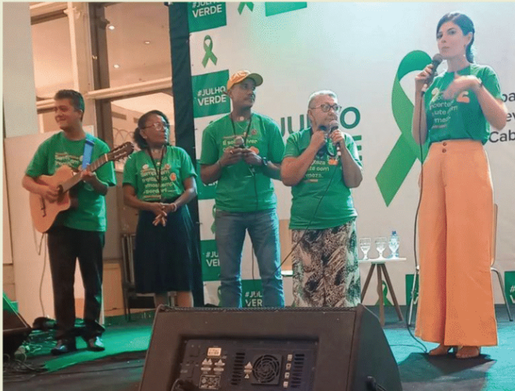
Shopping São Luís. São Luís - MA