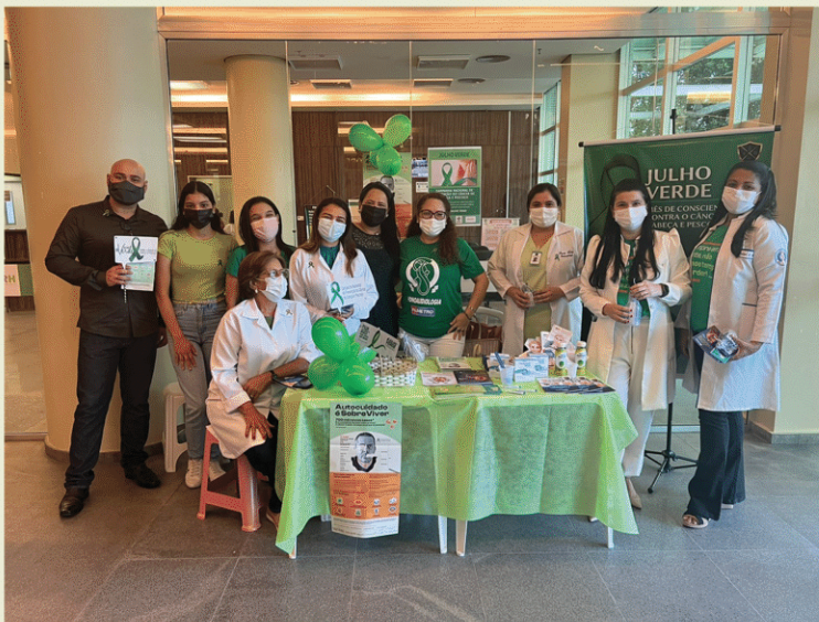
HU Getúlio Vargas + LAFA. Manaus - AM