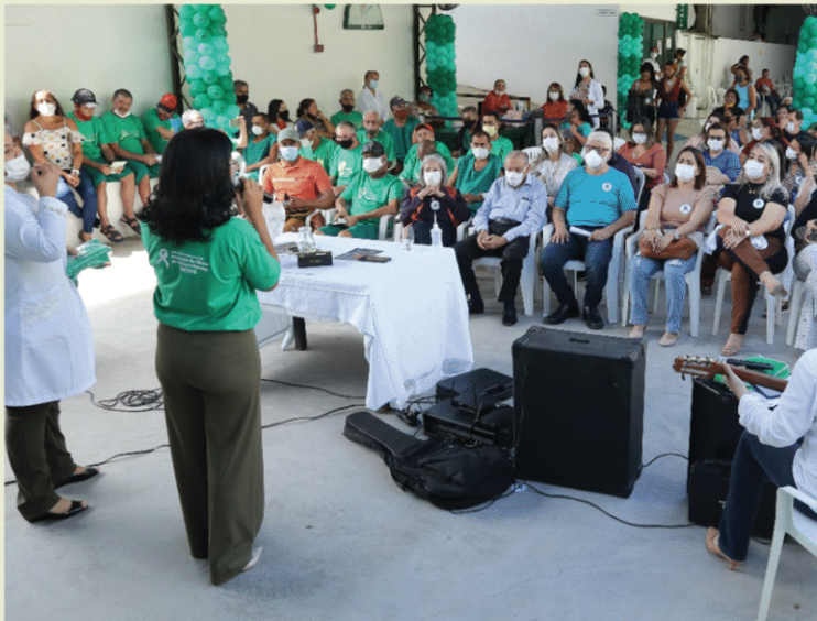
Hospital Apami. Vitória de Santo Antão - PE