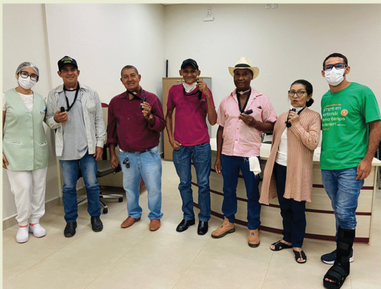
Hospital de Amor Amazônia. Porto Velho - RO