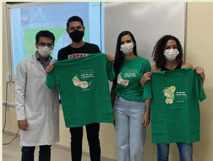
Universidade Federal de Roraima. Boa Vista - RR