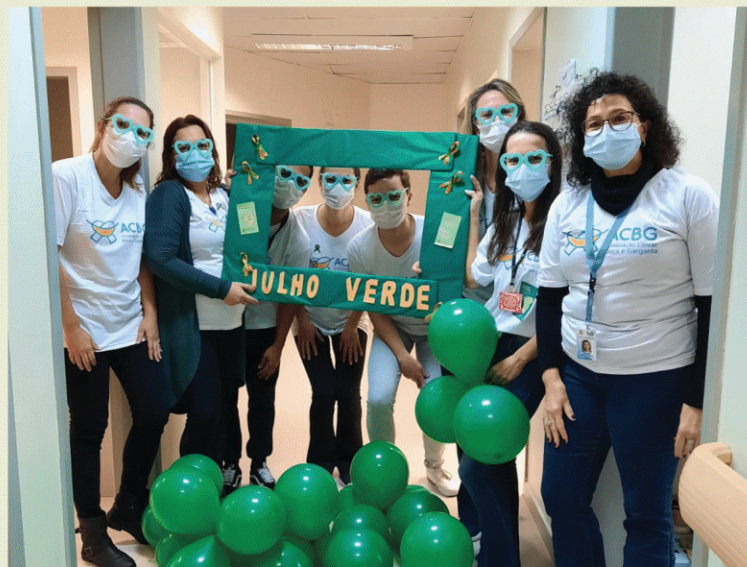
HU UFSC. Florianópolis - SC