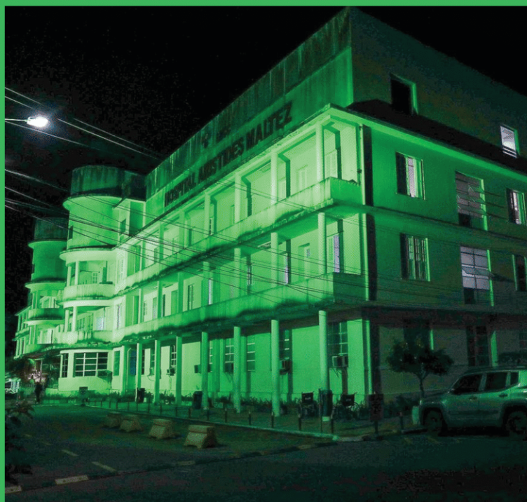
Hospital Aristides Maltez. Salvador - BA