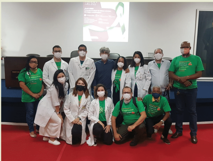
Hospital Aristides Maltez (HAM). Salvador - BA