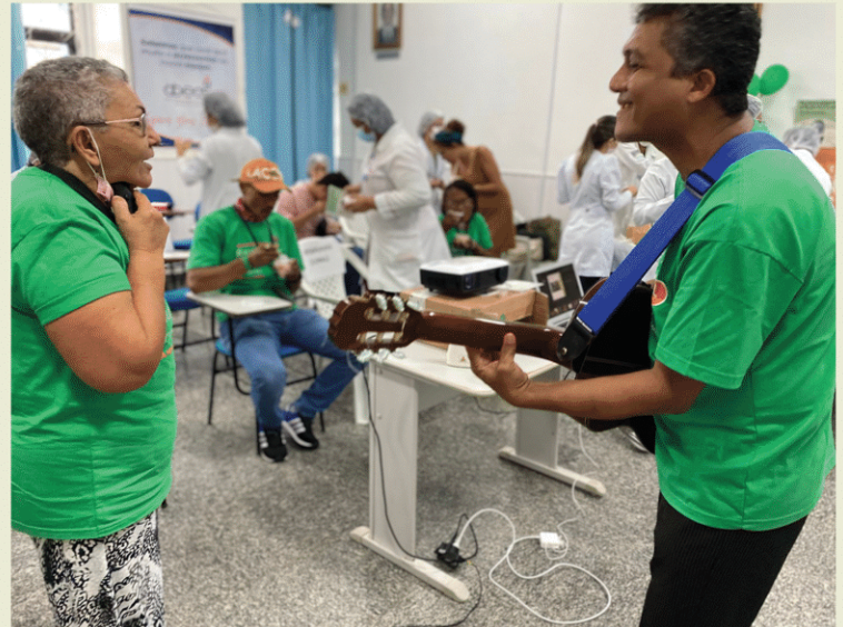
Hospital de Câncer do Maranhão. São Luis - MA