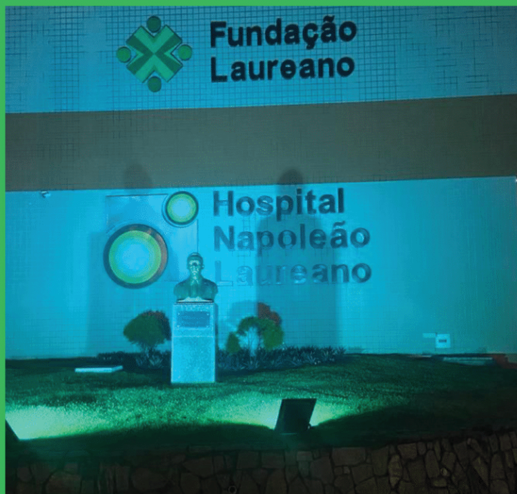
Hospital Napoleão Laureano João Pessoa - PB