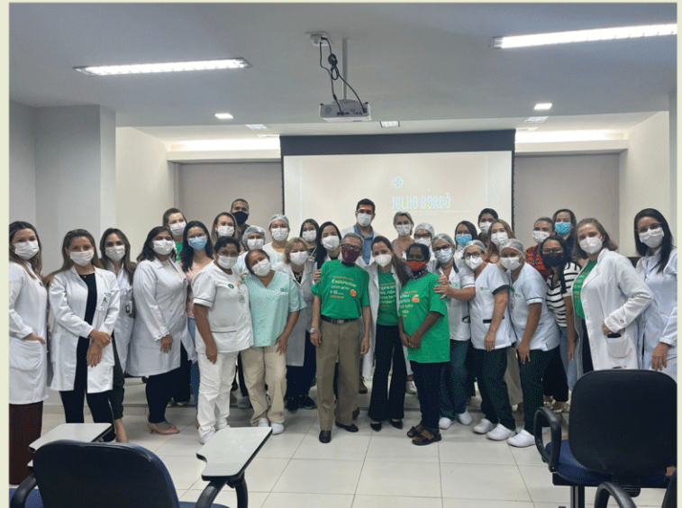
Hospital Napoleão Laureano. João Pessoa - PB