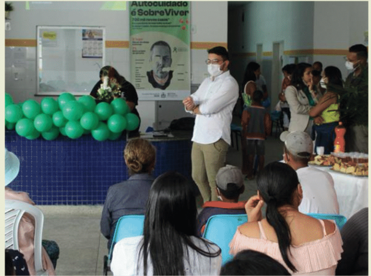
Secretaria Municipal do Riachão do Dantas. Riachão do Dantas - SE