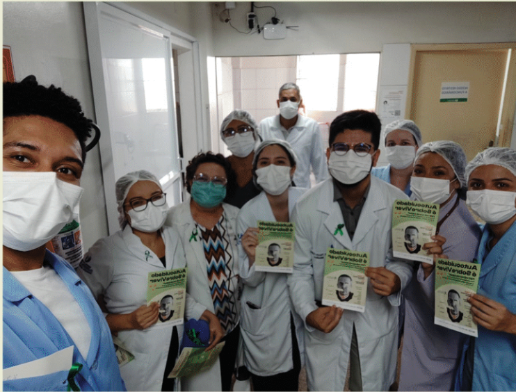
Hospital Aldenora Bello. São Luís - MA