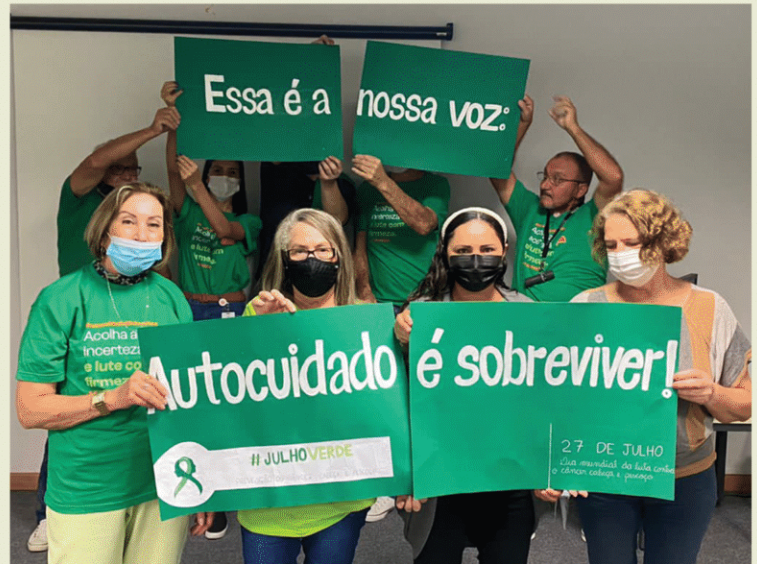
Hospital Regional de Jundiáí. Jundiáí - SP