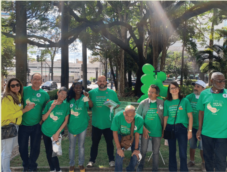
Orcca (Organização Regional de Combate ao Câncer). Betim - MG