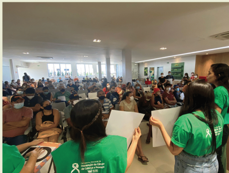
Centro Regional Integrado de Oncologia + Associação Nossa Casa. Fortaleza - CE