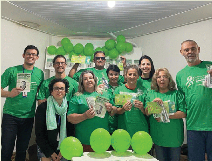
Secretaria de Saúde Bucal de Porto Belo . Porto Belo - SC