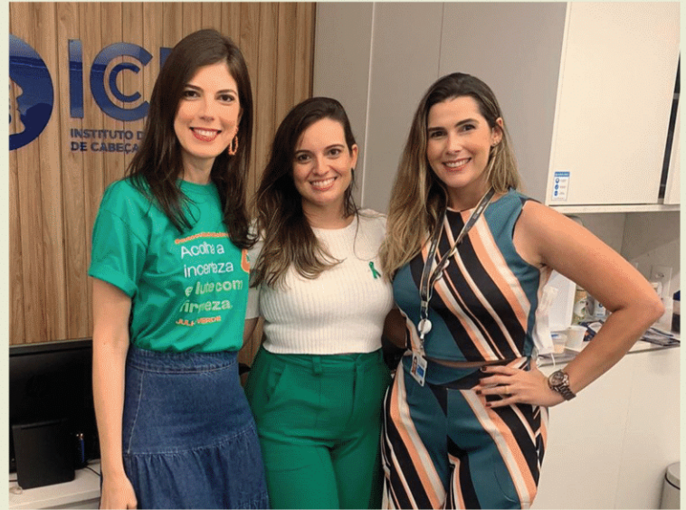
Clínica Instituto de Cirurgia de Cabeça e Pescoço com Nutrição. São Luís - MA