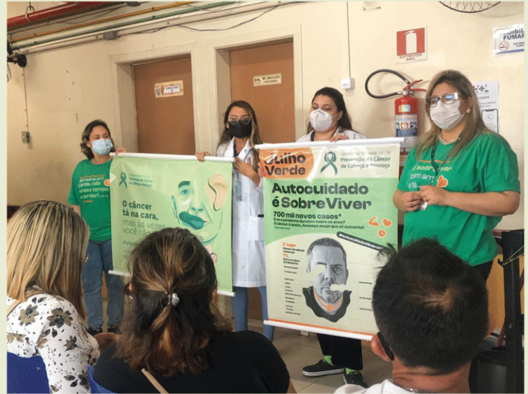
Hospital Ophir Loyola. Belém - PA